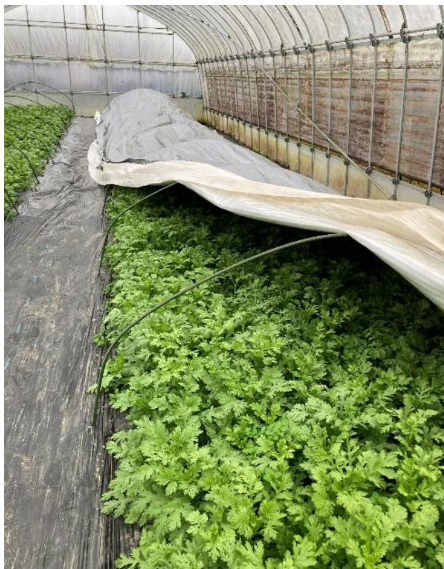
ホットサンドシートシルバー