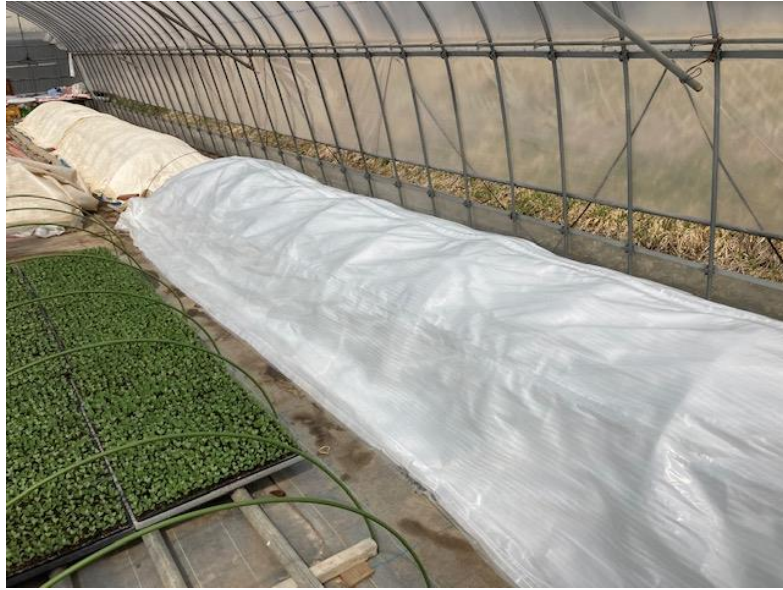
ホットサンドシート透明