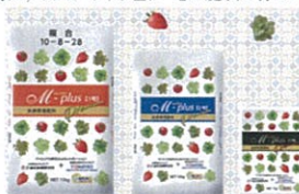
M-plus1号 M-plus2号 M-plus5号