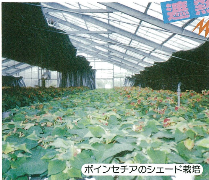
ポインセチアのシェード栽培