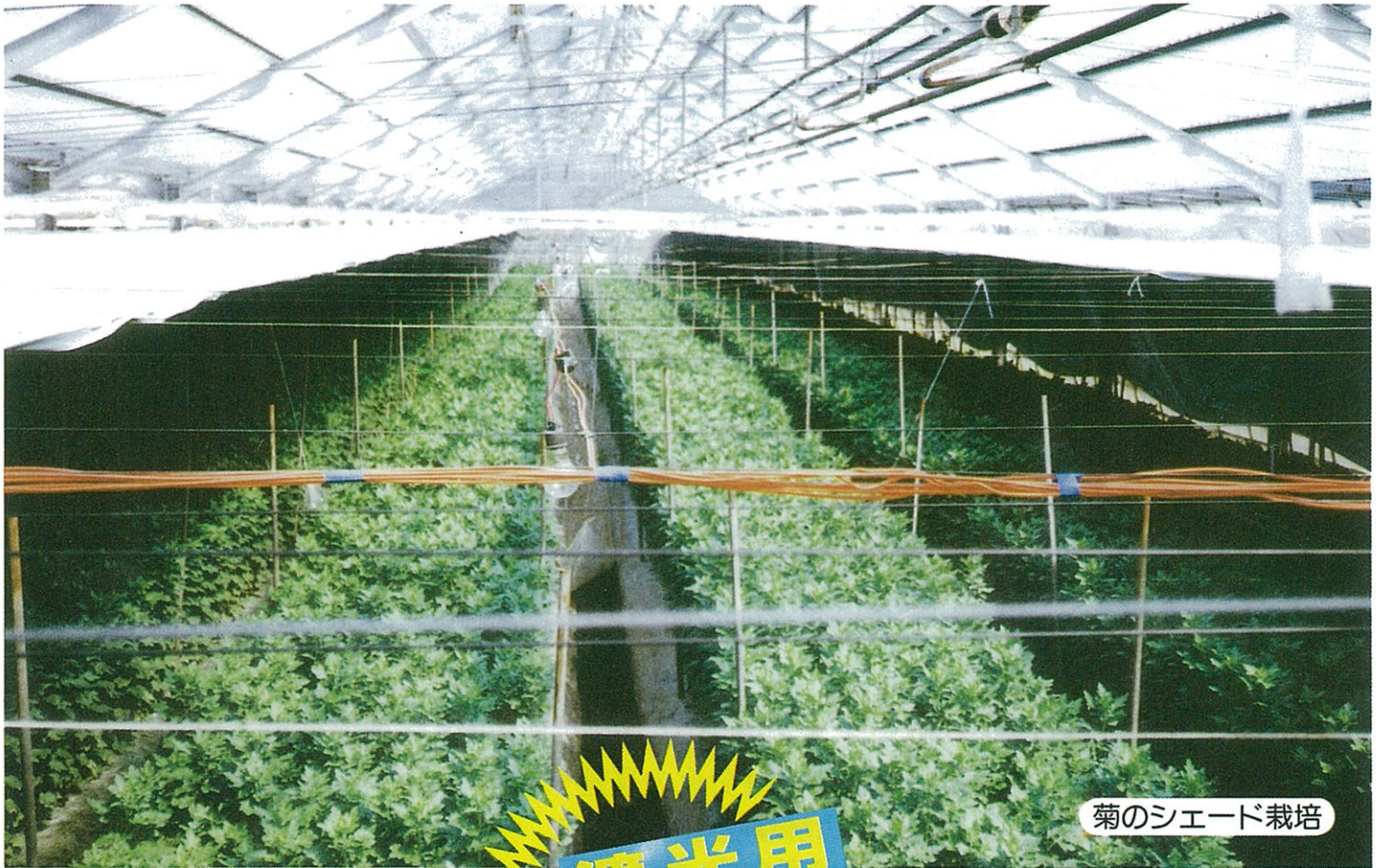
菊のシェード栽培