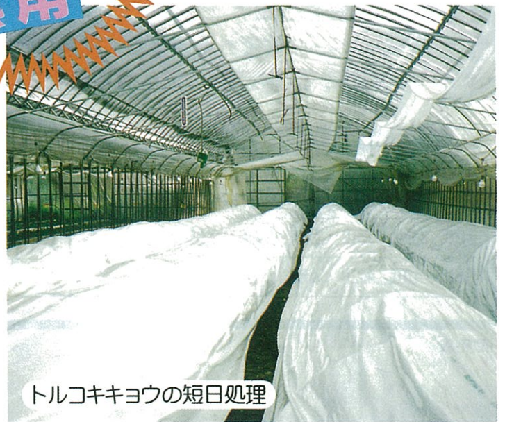
トルコキキョウの短日処理