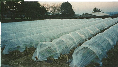
露地トンネル栽培